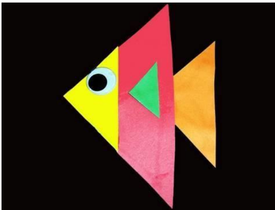
¿Qué podemos hacer con triangulos? - Pezcado - manualidadesconinos https://youtu.be/InxZO9bLX80