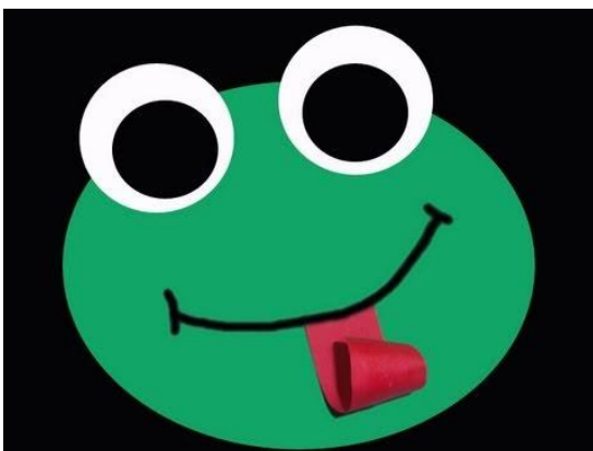
Cómo hacer una rana con papel de construcción - manualidadesconninos https://youtu.be/p9MYUMHV4Tk