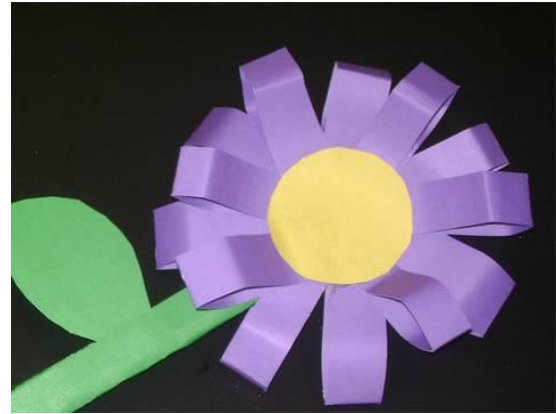
Como hacer una flor en 3D con cartulina o papel de construcción - manualidadesconninos https://youtu.be/dUZDOG73GSw