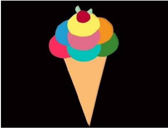
¿Qué podemos hacer con papel? - Helado - manualidadesconninos https://youtu.be/JUwWzQOBtSM