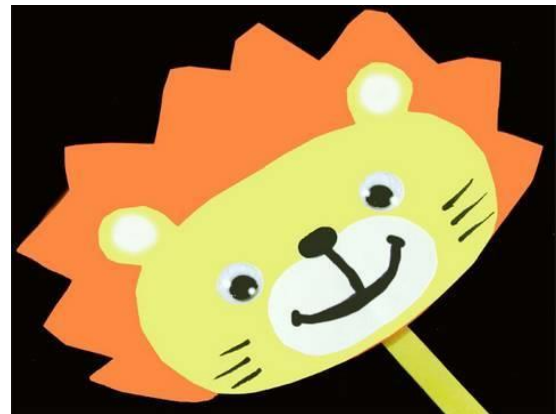
Manualidades de papel: León - Titere - manualidadesconninos https://youtu.be/Z42G16zAvoc